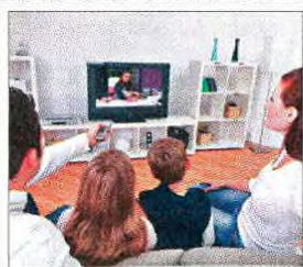
Apoio às famílias também passa por cartões que oferecem descontos

Alcoutim, Barcelos, Boticas, Cantanhede, Mértola, Oliveira de Azeméis, Oliveira do Hospital ou Santarém estão na lista das autarquias com atividades gratuitas para crianças durante as férias, prestando apoio às famílias com dificuldades financeiras ou que não encontram espaços para deixar os filhos. ●